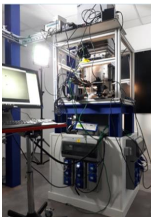
Figure 1 : veine d'essai de la soufflerie givrante et schéma de principe de la méthode envisagée

Dans ce contexte, la mesure de la température de paroi est un élément clé pour l'analyse physique des processus de givrage et d'antigivrage/dégivrage, l'amélioration de la modélisation et la validation des codes de calculs. Les données expérimentales de la littérature pour ce type de systèmes se basent pour la plupart sur des mesures ponctuelles de température à l'aide de thermocouples ou de thermistors [2-4]. Cependant, le champ de température présente souvent des variations spatiales fortes nécessitant une analyse fine que seule une technique d'imagerie peut fournir. Pour cela, il existe des techniques de mesures à l'aide de caméras infrarouges permettant d'accéder à la mesure du champ surfacique de température [5-7]. Ces dernières ne peuvent cependant pas être appliquées à l'étude du givrage car l'eau liquide et le givre sont opaques aux infrarouges et la température mesurée ne reflète donc pas la température de la surface sous la glace.